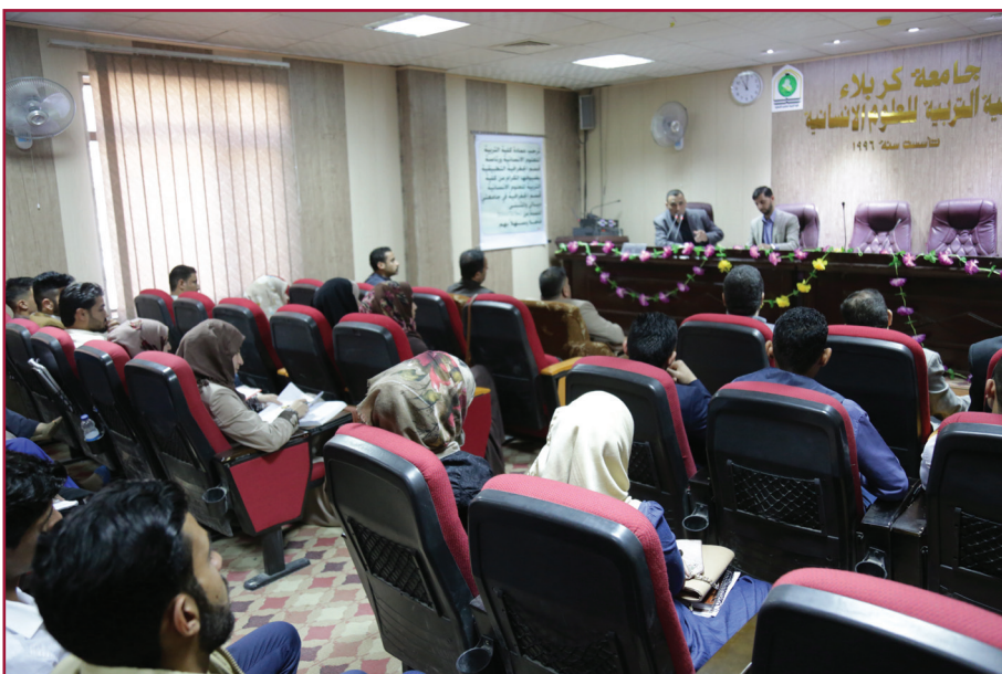
ندوة مركز تراث كربلاء السادسة عشرة