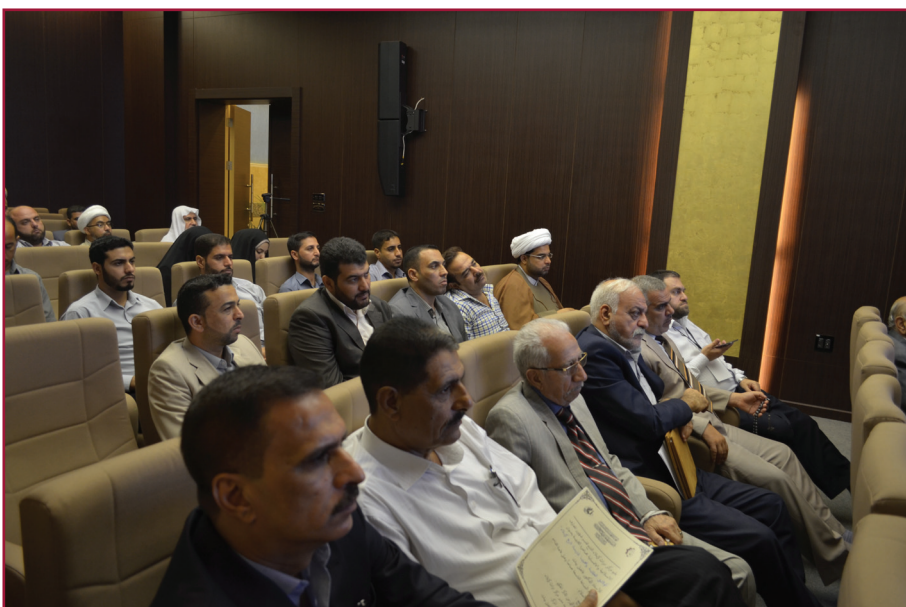
ندوة مركز تراث كربلاء العاشرة