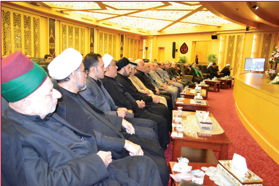
ندوة مركز تراث كربلاء الثانية عشرة