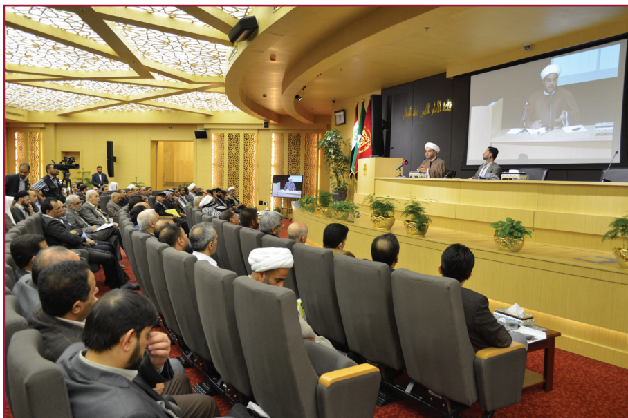
ندوة مركز تراث كربلاء السابعة