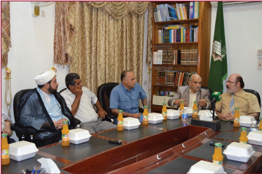
ندوة مركز تراث كربلاء الأولى