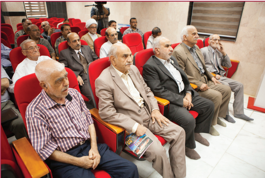
ندوة مركز تراث كربلاء الثانية