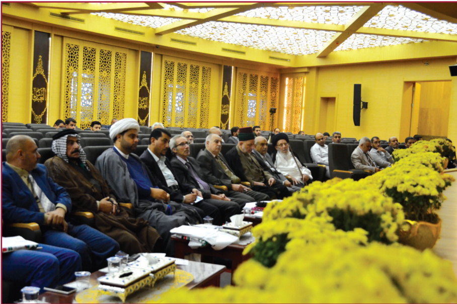
ندوة مركز تراث كربلاء الحادية عشرة