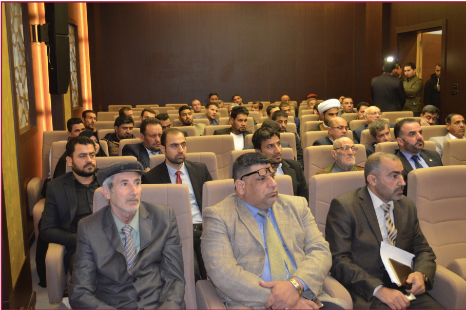
ندوة مركز تراث كربلاء الرابعة عشرة