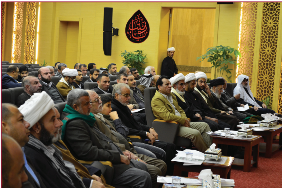
ندوة مركز تراث كربلاء الثالثة عشرة