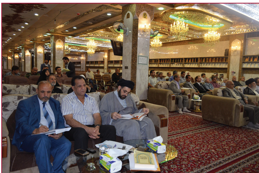
ندوة مركز تراث كربلاء التاسعة