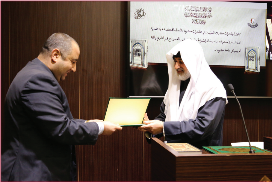
ندوة مركز تراث كربلاء الخامسة عشرة