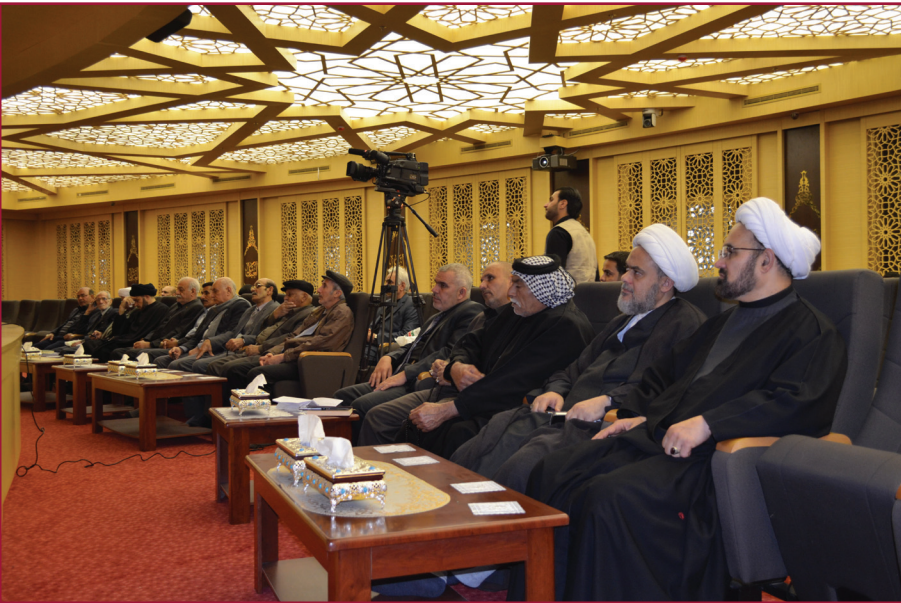
ندوة مركز تراث كربلاء الرابعة