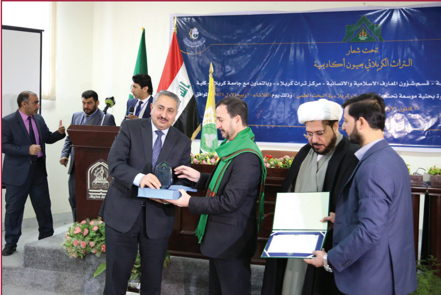
ندوة مركز تراث كربلاء الثامنة عشرة