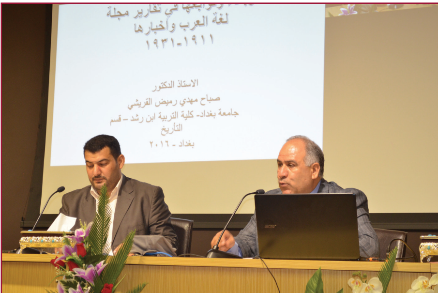
ندوة مركز تراث كربلاء السابعة عشرة