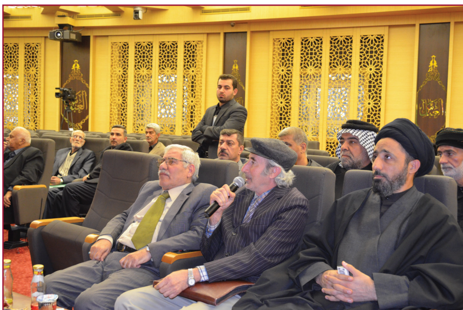
ندوة مركز تراث كربلاء الثالثة