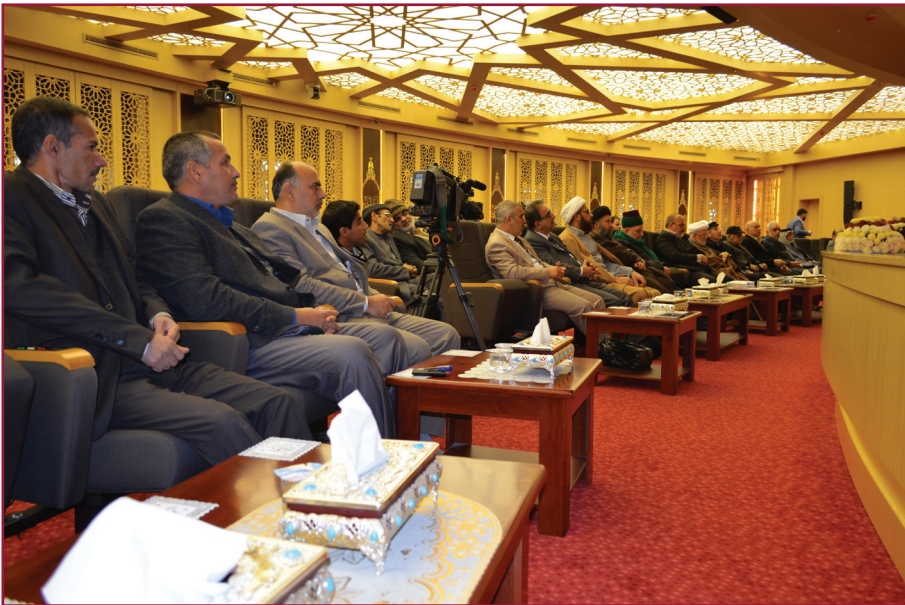
ندوة مركز تراث كربلاء الخامسة