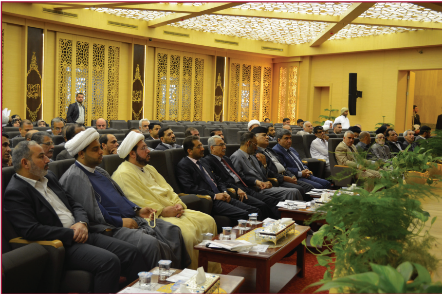
ندوة مركز تراث كربلاء الثامنة