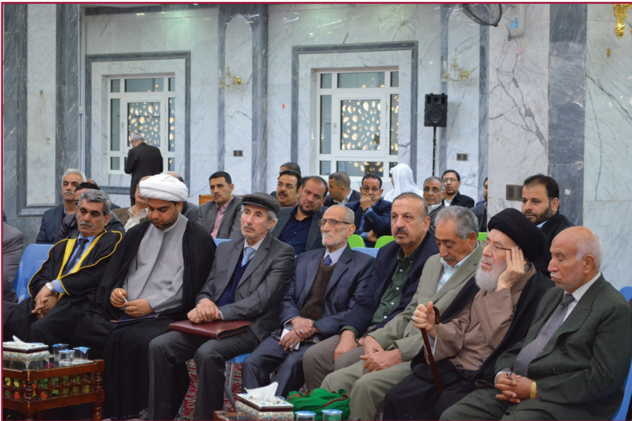
ندوة مركز تراث كربلاء السادسة